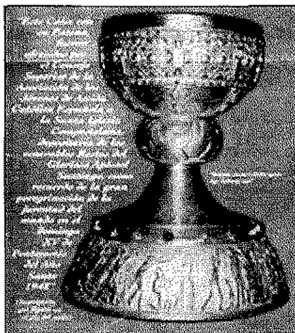
Caliz ofrendado a la Catedral de Compostela por los Jóvenes de Acción Católica en su magna peregrinación a Santiago en 1948

Hoy, este bordón peregrino vuelve a Compostela, sesenta años después, para quedarse para siempre contigo, Santo Apóstol. En él van nuestros corazones. Amén..